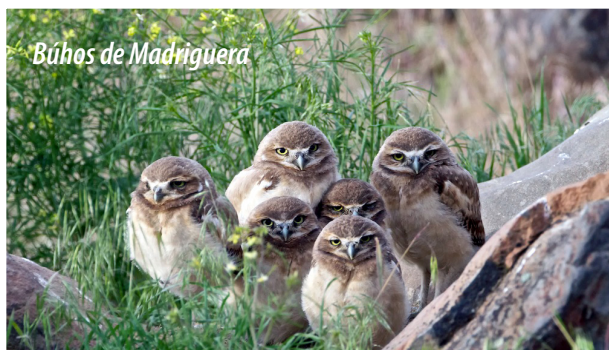
Búhos de Madriguera